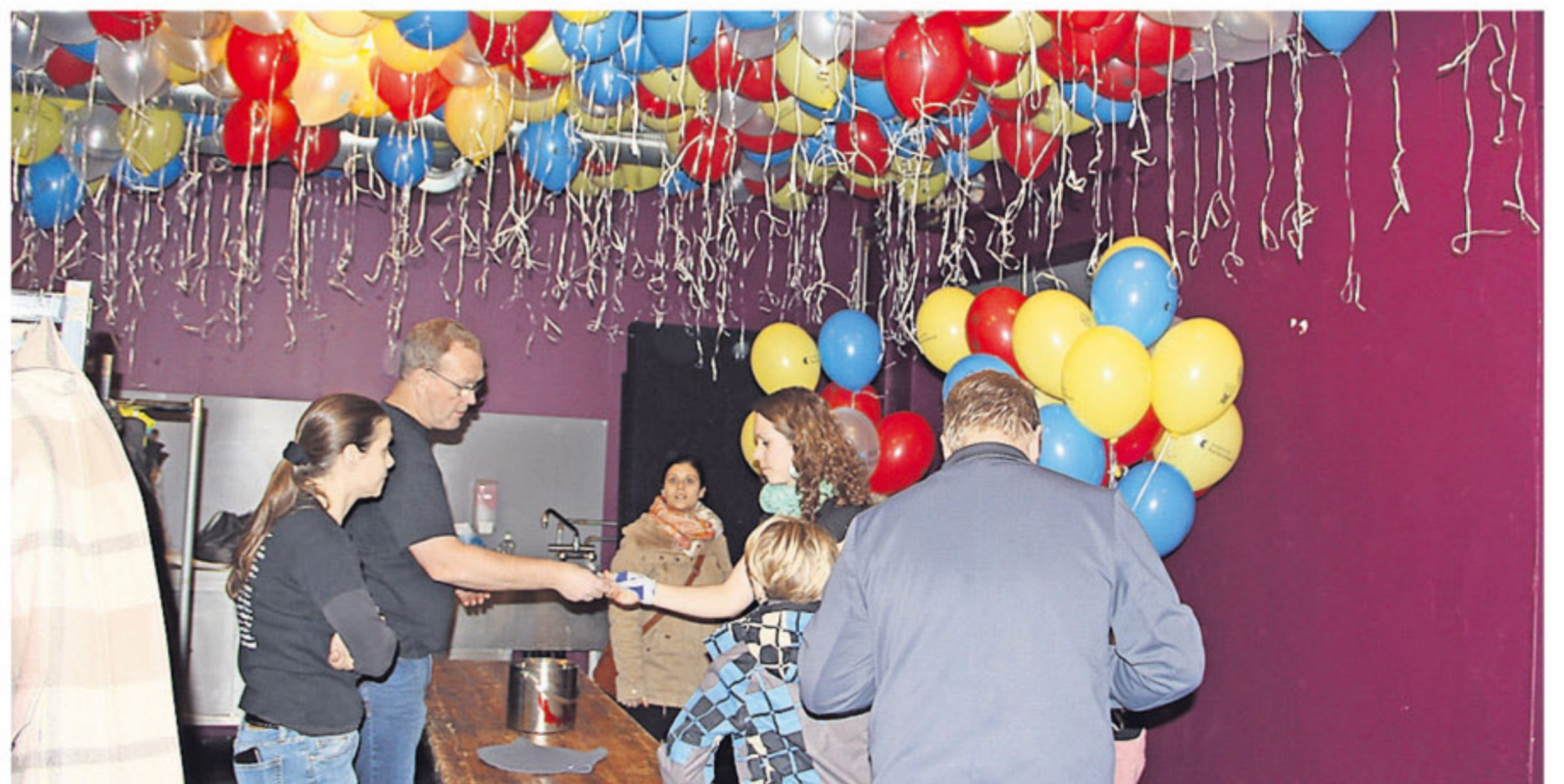
ZAHRLICHE BALLONE warteten nach dem Konzert im Garderobenbereich auf die Kinder.