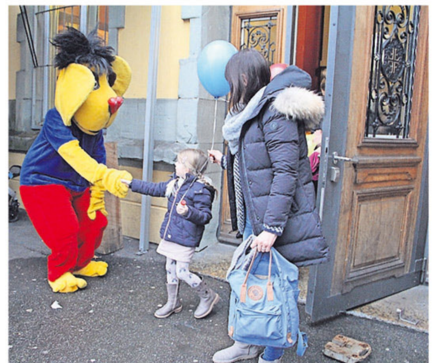
Das Aargauische Kantonalbank Maskottchen « KABI » verabschiedete die Kinder mit einem Händedruck.