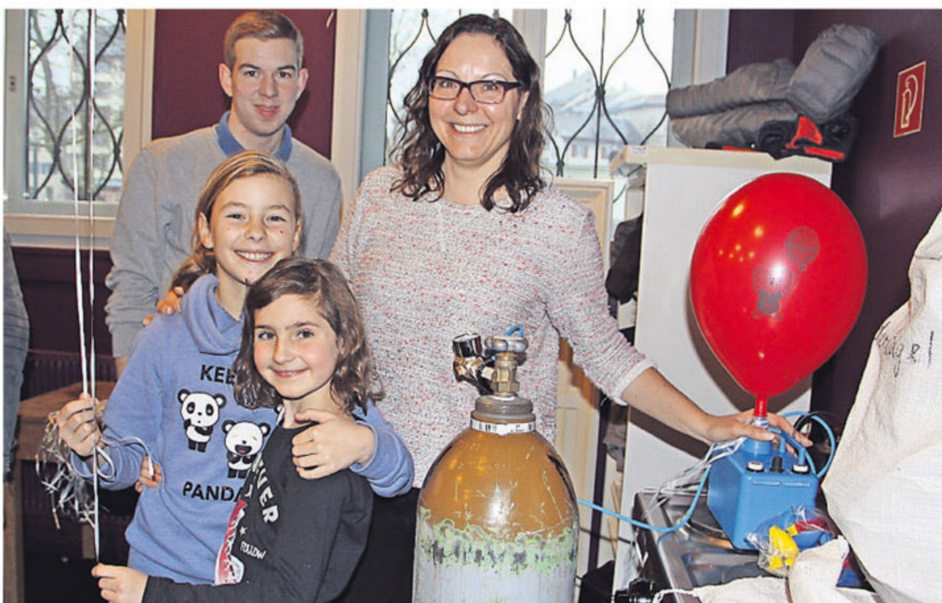
Das BALLON-TEAM der Aargauischen Kantonalbank nutzte das Konzert, um die rund 350 Ballone aufzublasen.